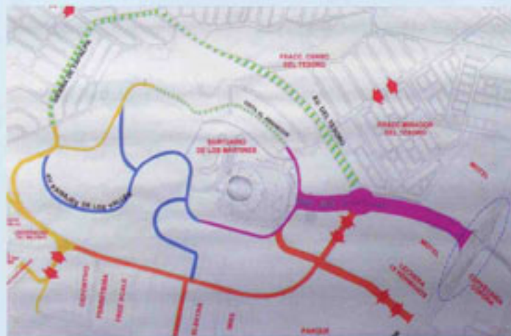
■ Así quedará la zona del cerro del tesoro según lo dio a conocer el presidente municipal de San Pedro, Tlaquepaque.

* En breve se colocará una estatua de San Pedro, con motivo del cambio de nombre del municipio