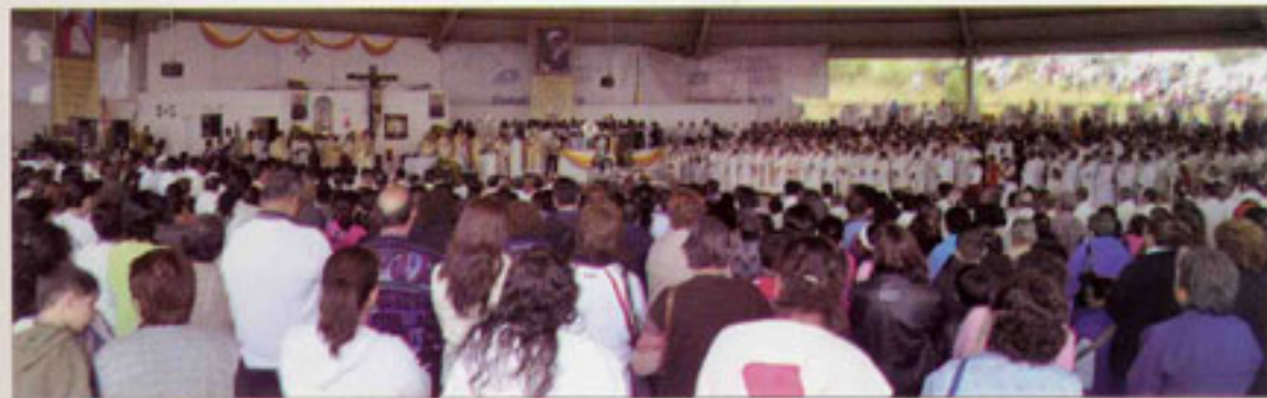
Insuficiente resultó la Capilla provisional para albergar a cientos de presbíteros y miles de fieles.