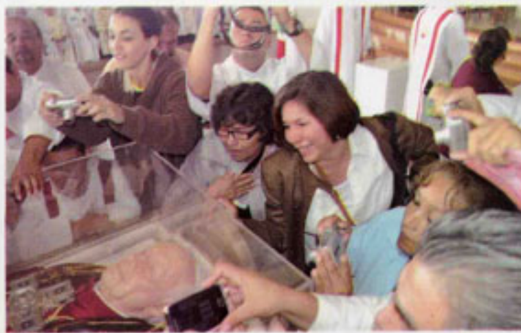
Rezos y llanto provocó la presencia de las reliquias del Beato Juan Pablo II