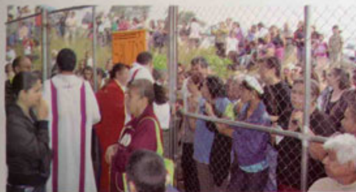
Pese a que cientos de católicos no alcanzaron lugar dentro de la capilla, encontraron un buen sitio para participar en la celebración eucarística.