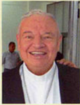
Cardenal Juan Sandoval Iñiguez